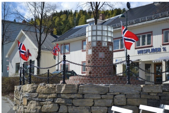
Arbeidermonumentet på Gamletorvet - viser byens arbeiderhistorie, begivenheter og utviklingstrekk som våre partier fører videre.